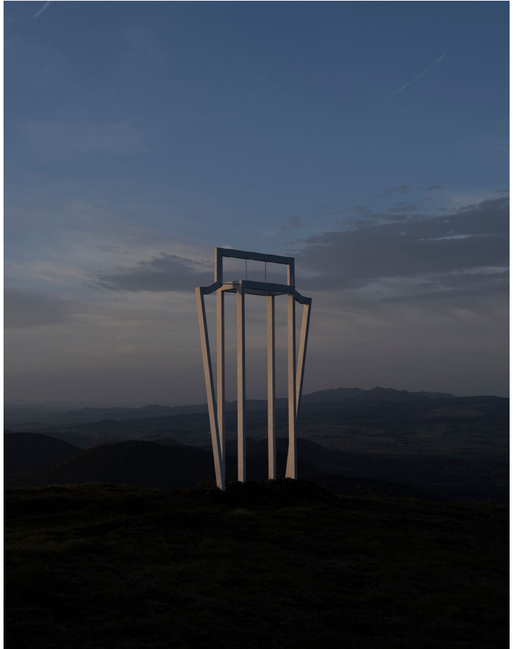
Taygeta, 2022, Sabine Mirlesse. Taygeta, 2022, Sabine Mirlesse.