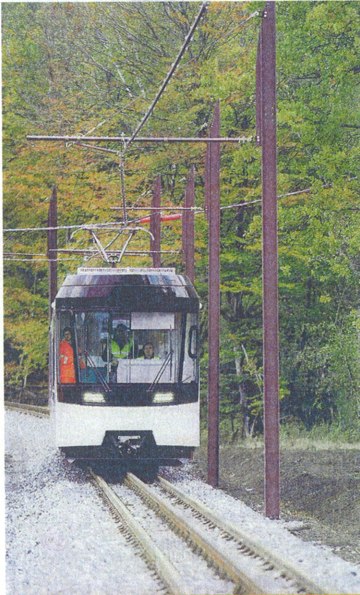
Les essais font l'objet d'une planification et d'un suivi très rigoureux de l'apart de SNC Lavalin et Stadler, le constructeur du train.

Au printemps 2012, le Panoramique des Dômes transportera les voyageurs vers le sommet du puy de Dôme. L'occasion de dresser un coup de projecteur sur ce chantier emblématique.