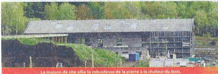
La maison de site allie la robustesse de la pierre à la chaleur du bois.