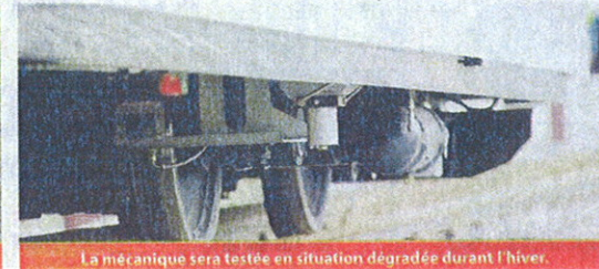
La mécanique sera testée en situation dégradée durant l'hiver.