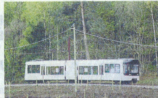
La vitesse moyenne de circulation du train ne dépasse pas les 20 km/h.